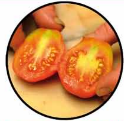
Pomodoro Ciettaicàle di Tolve