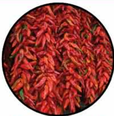
Peperone di Senise